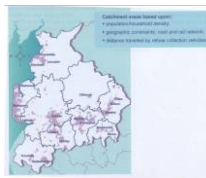
L'unità amministrativa del Lancashire